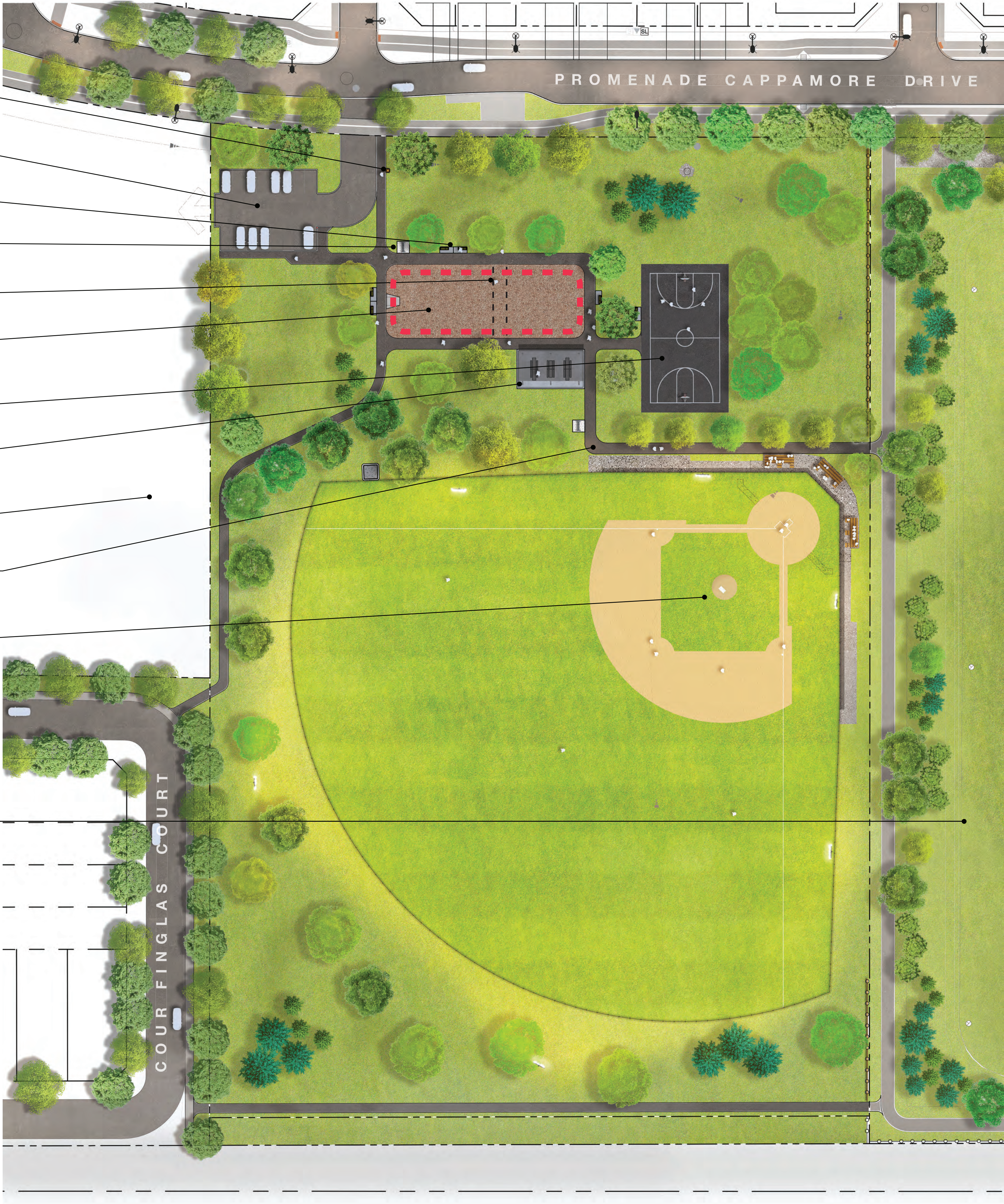
PLAY / FITNESS AREA - OPTION 1 AIRE DE JEUX / DE CONDITIONNEMENT PHYSIQUE - OPTION 1