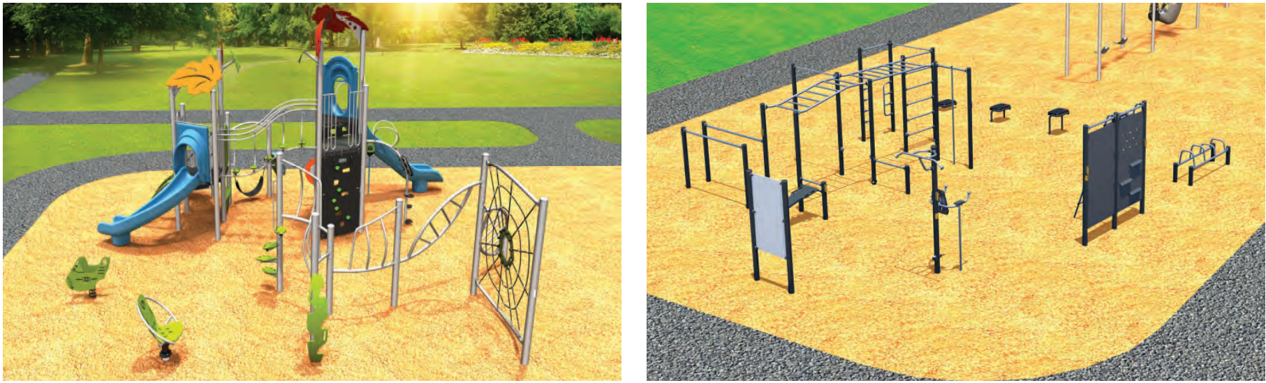
PLAY / FITNESS AREA - OPTION 2 AIRE DE JEUX / DE CONDITIONNEMENT PHYSIQUE - OPTION 2